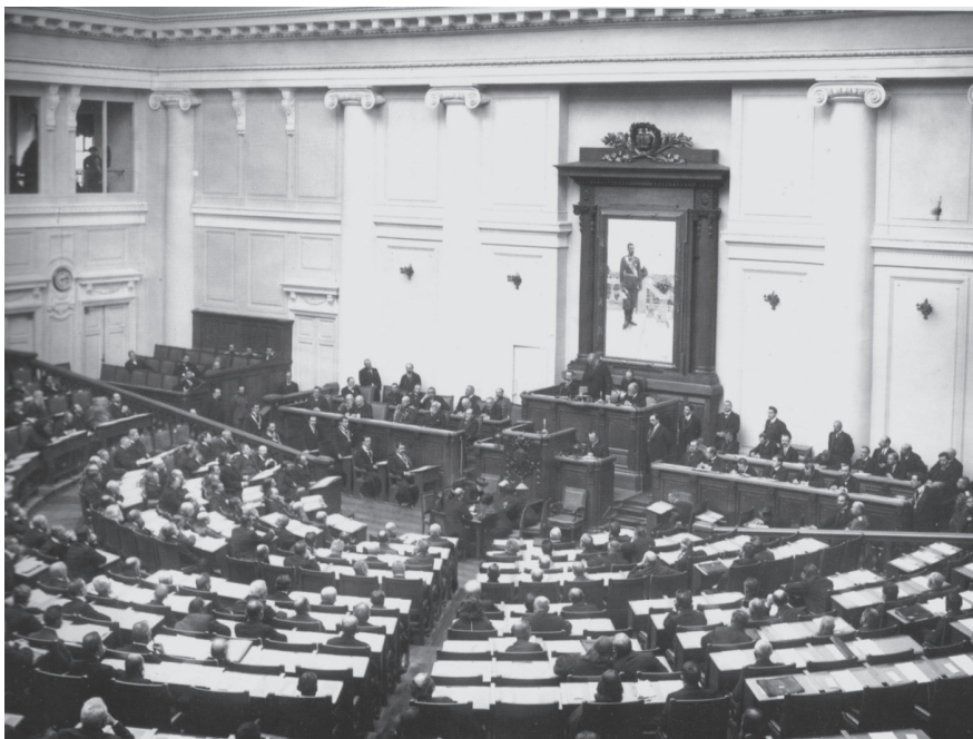
На заседании Третьей Государственной Думы