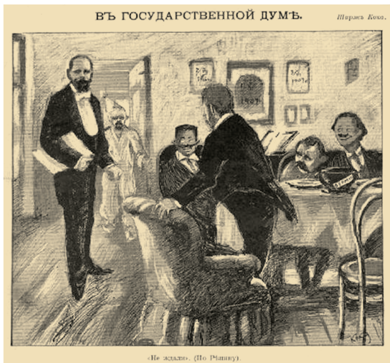
Карикатура на Председателя Совета министров П. А. Столыпина и депутатов Государственной Думы