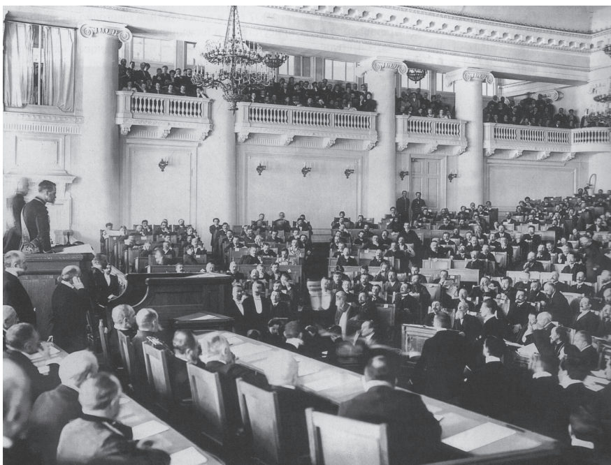
Первое заседание Второй Государственной Думы (20 февраля 1907 года)