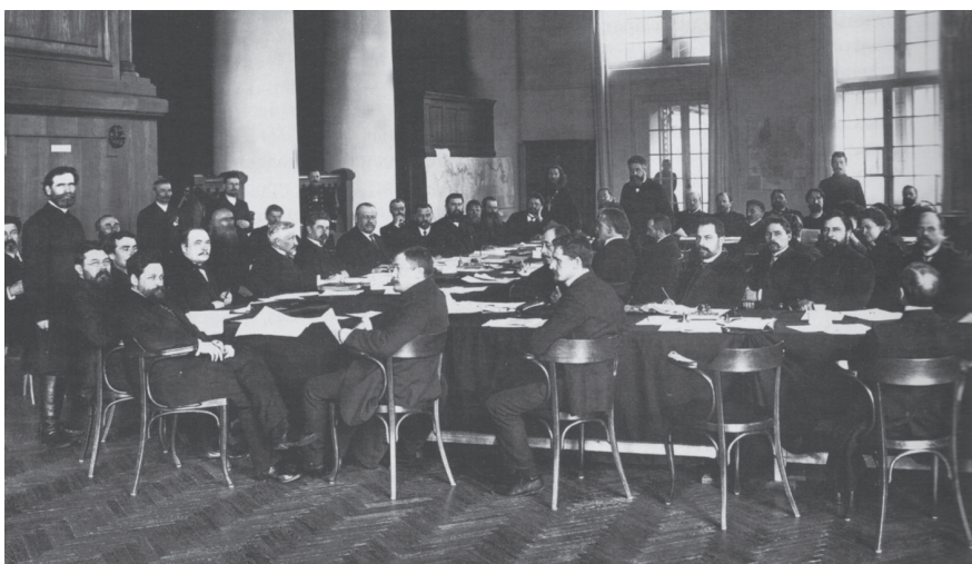
Совещание октябристов в Третьей Думе