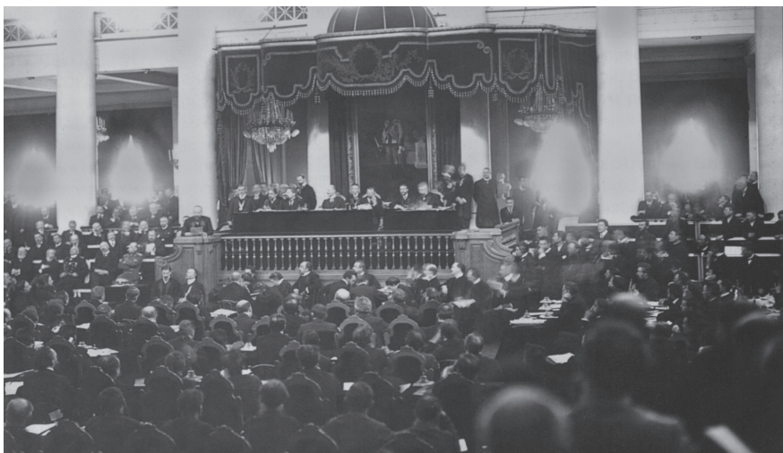
Выступление П. А. Столыпина в Государственной Думе 6 марта 1907 года