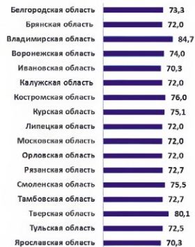
Цены на диз топливо 25.09.2023

Если взять ситуацию в Приволжском федеральном округе, здесь вообще цены зашкаливают. Посмотрите, на слайде эти все показатели просто пылают красным цветом, так как весь сентябрь рост цен на топливо в этом регионе просто зашкаливает!