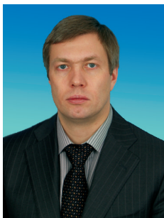
А.Ю. РУССКИХ, заместитель председателя Комитета Государственной Думы по науке и наукоёмким технологиям

Работая в Комитете по науке и наукоёмким технологиям, я участвовал в обсуждении восьми разработанных комитетом законопроектов, а также в парламентских слушаниях, «круглых столах» и выездных мероприятиях. Активно участвовал и выступал с докладами на «круглых столах» и парламентских слу-