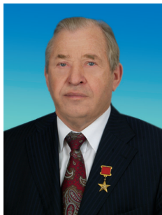
В.А. СТАРОДУБЦЕВ, член Комитета Государственной Думы по аграрным вопросам, член ЦК КПРФ

Взаимодействие с жителями Тульской области — всегда один из приоритетов моей деятельности. В городе и ряде районов области работают постоянно действующие общественные приемные. В 2010 году провел 12 официальных приемов граждан в г. Туле и районах области. Кроме того, часть избирателей принимал в селе Спасское Новомосковского района в выходные дни.