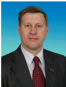
А.Е. ЛОКОТЬ, член Комитета Государственной Думы по вопросам местного самоуправления, член ЦК КПРФ

В 2010 году я работал в Комитете Государственной Думы по вопросам местного самоуправления. Когда в осеннюю сессию в нижней палате обсуждались изменения в Федеральный закон «Об общих принципах организации местного самоуправления», то я выступал против таких изменений: они фактически ликвидируют местное самоуправление районных центров.