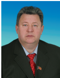
В.И. КАШИН, заместитель председателя Комитета Государственной Думы по природным ресурсам, природопользованию и экологии, заместитель Председателя ЦК КПРФ

2010 год уже стал историей, но еще долго будет оказывать влияние на дальнейшее развитие России. Тем более что наступивший 2011 год открывает электоральное двухлетие: выборы в Государственную Думу и президента страны. Обостряется социально-экономическая ситуация, меняются политические настроения. Экономика страны продолжает крепко сидеть на нефтегазовой игле, более 40% ВВП создается за счет экспорта сырья. Идея президента о модернизации экономики, похоже, забалтывается.