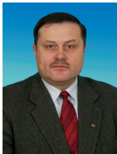
В.Г. СОЛОВЬЕВ, член Комитета Государственной Думы по конституционному законодательству и государственному строительству, секретарь ЦК КПРФ

В соответствии с Конституцией Российская Федерация является правовым демократическим государством, в котором признаются политический плюрализм и идеологическое многообразие. Однако на практике власть, опасаясь роста оппозиционных настроений среди граждан, систематически использует административные рычаги для борьбы со своими политическими оппонентами. Традицией стали судебные иски руководителей ряда регио-