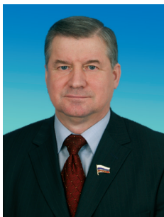
С.И. ШТОГРИН, заместитель председателя Комитета Государственной думы по бюджету и налогам, член ЦК КПРФ

В 2010 году основные усилия я направил на осуществление законодательной деятельности. Самостоятельно и в сотрудничестве с другими депутатами фракции подготовлено и внесено в Государственную Думу 16 проектов феде-