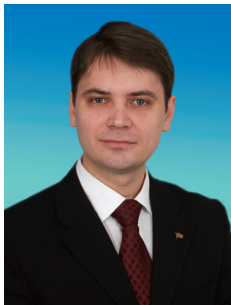
А.В. КОРНИЕНКО, член Комитета Государственной Думы по строительству и земельным отношениям, член ЦКРК КПРФ

Безудержный рост платы за жилищно-коммунальные услуги приобретает скорее политический характер, чем экономический. Не случайно эту отрасль называют жилищно-криминальной. Помимо завышенных нормативов за коммунальные услуги, чиновниками придумываются различные дополнительные способы по отъему средств у населения.