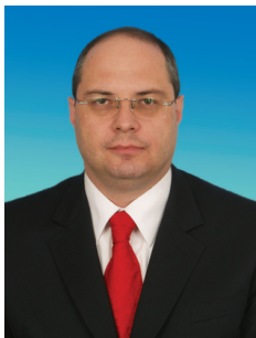
С.А. ГАВРИЛОВ, заместитель председателя Комитета Государственной Думы по транспорту

Являясь заместителем председателя Комитета Государственной Думы по транспорту, я руковожу работой созданного при нашем комитете Экспертного совета по гражданской авиации, государственной авиации, использованию воздушного пространства. Четырежды выступал на пленарных заседаниях. 10 февраля 2010 года от имени фракции КПрФ на «правительственном часе» поднял актуальные проблемы, связанные с состоянием безопасности движения.