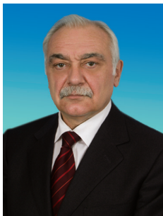
С.В. МУРАВЛЕНКО, член Комитета Государственной Думы по природным ресурсам, природопользованию и экологии

Прошедший 2010 год в моей депутатской деятельности в Государственной Думе и в Белгородской области выдался насыщенным и разнообразным. На заседаниях Комитета по природным ресурсам, природопользованию и экологии я неоднократно выступал при обсуждении проектов законов. Совместно с некоторыми депутатами Государственной Думы являюсь инициатором законопроектов «Об аквакультуре» и «О внесении изменений в Кодекс Российской Федерации об административных правонарушениях» (в части усиления административной ответственности хозяйствующих субъектов за несоблюдение нормативов допустимого воздействия на окружающую среду).