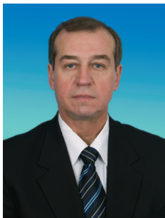
С.Г. ЛЕВЧЕНКО, член Комитета Государственной Думы по энергетике, член Президиума ЦК КПРФ

В федеральном бюджете на следующий год, принятом в 2010 году, урезаны по сравнению с прошлым годом все статьи, имеющие социальную направлен-