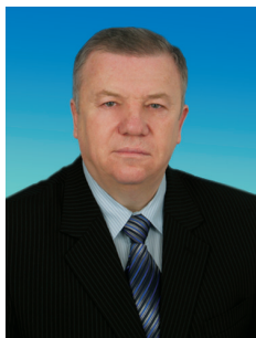
В.П. КОМОЕДОВ, член Комитета Государственной Думы по обороне, адмирал

Поскольку я веду работу с избирателями в двух крупных регионах (Ленинградской области и Республике Татарстан), серьезно пострадавших от экономического спада, то важными составляющими моей деятельности является борьба против нарушений социальных прав и содействие тем, кто оказался в тяжелой жизненной ситуации. За минувший год я объехал всю Ленинградскую область,