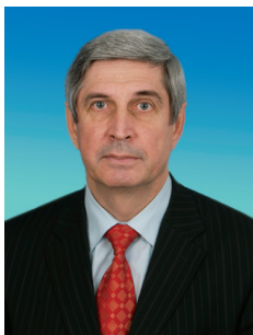
И.И. МЕЛЬНИКОВ, заместитель Председателя Государственной Думы, первый заместитель Председателя ЦК КПРФ

2010 год — это очередной этап в созревании капиталистических отношений в современной России, очередной шаг накопления противоречий этой алчной модели экономики. В России эти процессы отягощаются коррупцией, вседо-