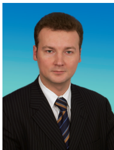
А.А. АНДРЕЕВ, член Комитета Государственной Думы по информационной политике, информационным технологиям и связи, кандидат в члены ЦК КПрФ

Вместе с коллегой по думской фракции А.В. Корниенко мне было доверено возглавить список КПрФ на выборах в Магаданскую областную Думу, что во многом определило характер моей работы в 2010 году. В основе нашей предвыборной платформы «Богатства Колымы — на службу народу» лежали Антикризисная программа КПрФ и учет местной специфики. Большинство жителей области не обеспечено достойными зарплатами и пенсиями и вынуждено