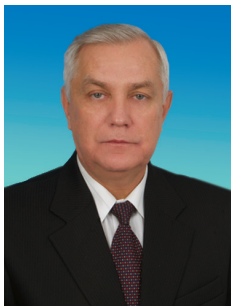
В.А. КОЛОМЕЙЦЕВ, член Комитета Государственной Думы по бюджету и налогам, член ЦКРК КПРФ

В 2010 году я провел 123 встречи с избирателями в городах и районах Ростовской области. В 24 городах и районах Ростовской области работают