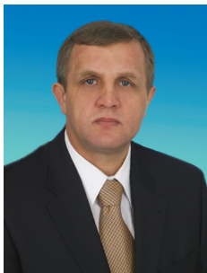
Н.В. КОЛОМЕЙЦЕВ, член Комитета Государственной Думы по труду и социальной политике, член Президиума ЦК КПРФ

Выступления на «правительственном часе» дают возможность депутатам оппозиции ясно выразить свою позицию по самым актуальным вопросам жизни нашего общества. Вот одно из таких выступлений, прозвучавшее от моего имени 30 июня прошлого года.