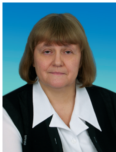
С.Е. САВИЦКАЯ, заместитель председателя Комитета Государственной Думы по обороне, дважды Герой Советского Союза, летчик-космонавт СССР