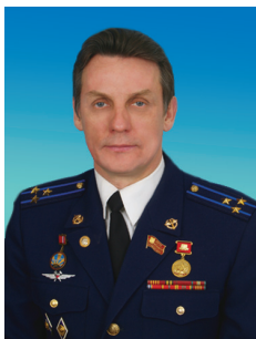
В.Д. УЛАС, член Комитета Государственной Думы по бюджету и налогам, член ЦК КПРФ

Парламентская деятельность складывается из весьма разнообразных форм. Одна из важнейших среди них — выступления в Государственной Думе. В 2010 году я выступал в Государственной Думе 47 раз. В качестве примера