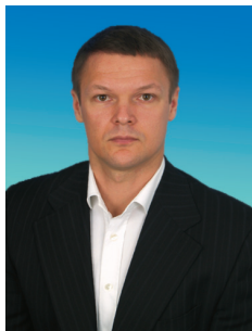
А.В. БАГАРЯКОВ, член Комитета Государственной Думы по финансовому рынку

В Государственной Думе я представляю Алтайский край. Он богат природными ресурсами, но здесь один из самых высоких по стране показателей безработицы и самый низкий по Сибири уровень жизни.