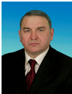
И.О. ЭДЕЛЬ, член Комитета Государственной Думы по транспорту, кандидат в члены ЦК КПРФ

В рамках работы в Комитете Государственной Думы по транспорту посещал предприятия транспортного комплекса, выступал на «круглых столах», выездных заседаниях комитета в Москве, Калуге, Нижнем Новгороде и так далее. Принимал участие в рассмотрении проекта легкого метро в г. Воронеже.