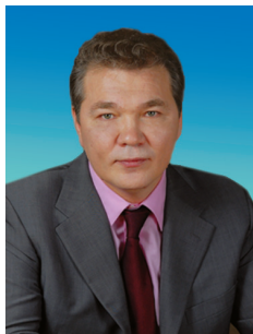
Л.И. КАЛАШНИКОВ, первый заместитель председателя Комитета Государственной Думы по международным делам, член Президиума ЦК КПРФ, секретарь ЦК КПРФ

По поручению фракции КПРФ в Государственной Думе моя депутатская работа в основном сосредоточена на международных вопросах. Так, 4 июня 2010 года я выступал от имени фракции на пленарном заседании Думы по вопросу о проекте федерального закона № 346064-5 «О внесении изменений в Федеральный закон «О государственной политике Российской Федерации в отношении соотечественников за рубежом». Смысл закона в сужении по-