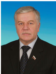
С.В. СОБКО, председатель Комитета Государственной Думы по промышленности

27 января на «правительственном часе» в Государственной Думе выступил Министр промышленности и торговли Российской Федерации В.Б. Христенко. По- зицию фракции КПРФ по обсуждавшимся вопросам изложил депутат С.В. Собко.