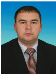
Ю.В. АФОНИН, член Комитета Государственной Думы по делам молодёжи, секретарь ЦК КПРФ

Работа депутата Государственной Думы состоит из двух составляющих: законотворчество и взаимодействие с избирателями. Формы работы над проектами законов разнообразны. Говоря о своей работе в Государственной Думе, отметил бы участие в такой важной стадии подготовки законов, как парламентские слушания и «круглые столы».