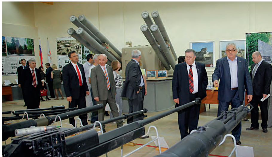
Председатель Комитета Государственной Думы по обороне В. П. Комоедов и губернатор Тульской области С. В. Груздев на выездных парламентских слушаниях Комитета Государственной Думы по обороне в г. Туле (2012 год)