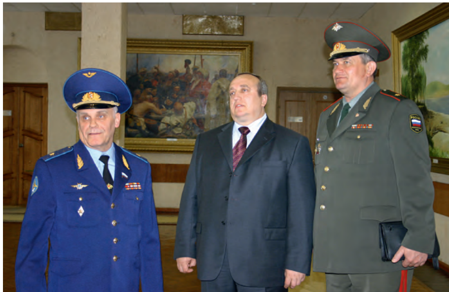
Выездное заседание Комитета Государственной Думы по обороне в г. Ростове-на-Дону (2007 год)