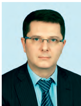
ЖИГАРЕВ Сергей Александрович

Депутат Государственной Думы Федерального Собрания Российской Федерации шестого созыва, член фракции ЛДПР.