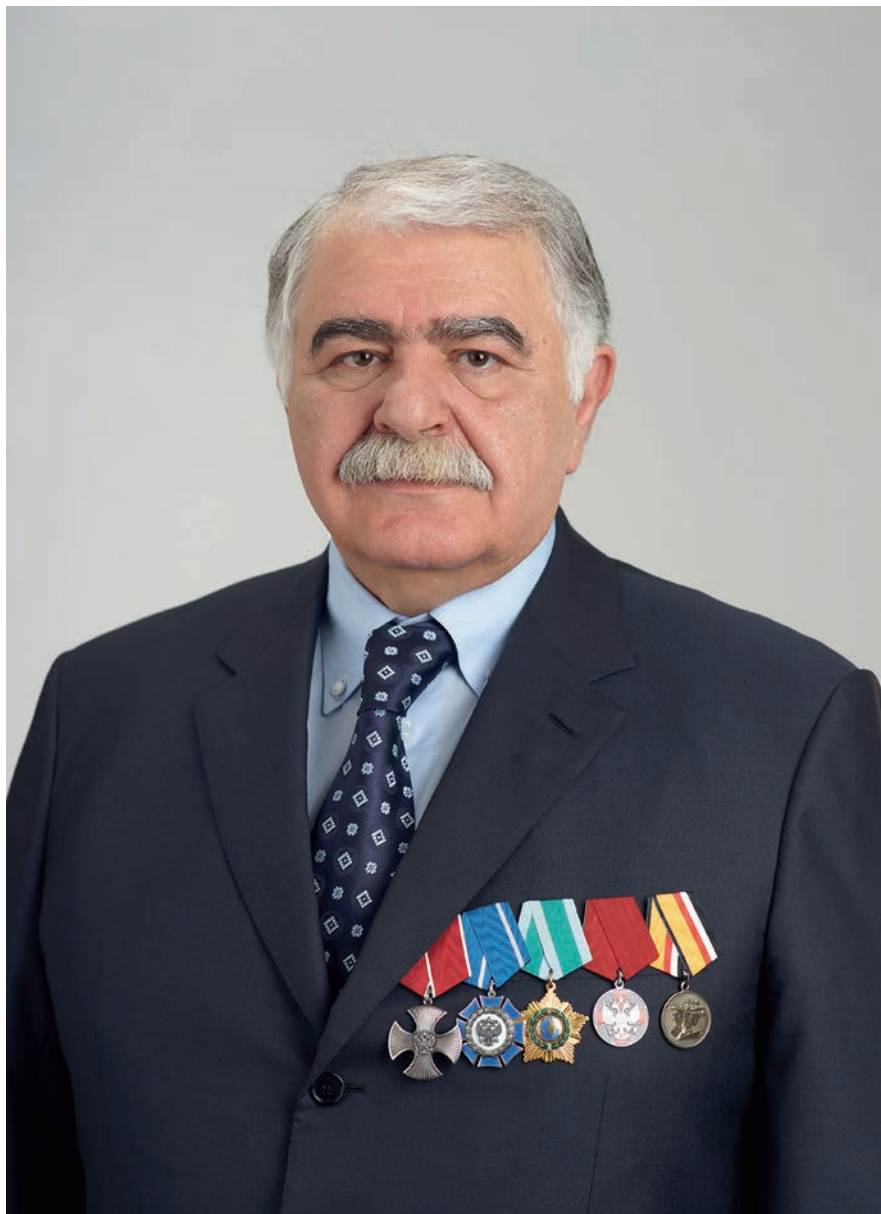
Член Комитета Государственной Думы по обороне Зелимхан Аликоевич Муцоев