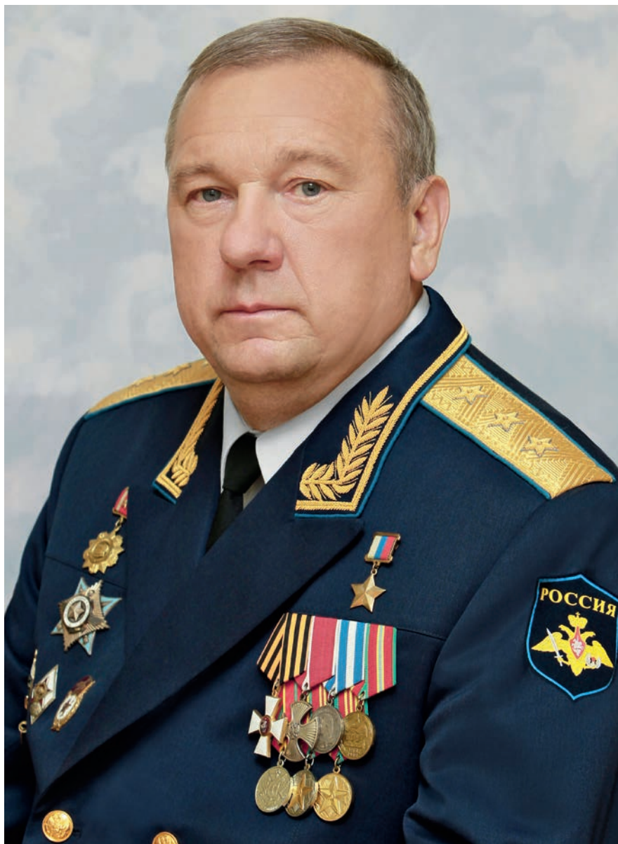
Председатель Комитета Государственной Думы по обороне Владимир Анатольевич Шаманов