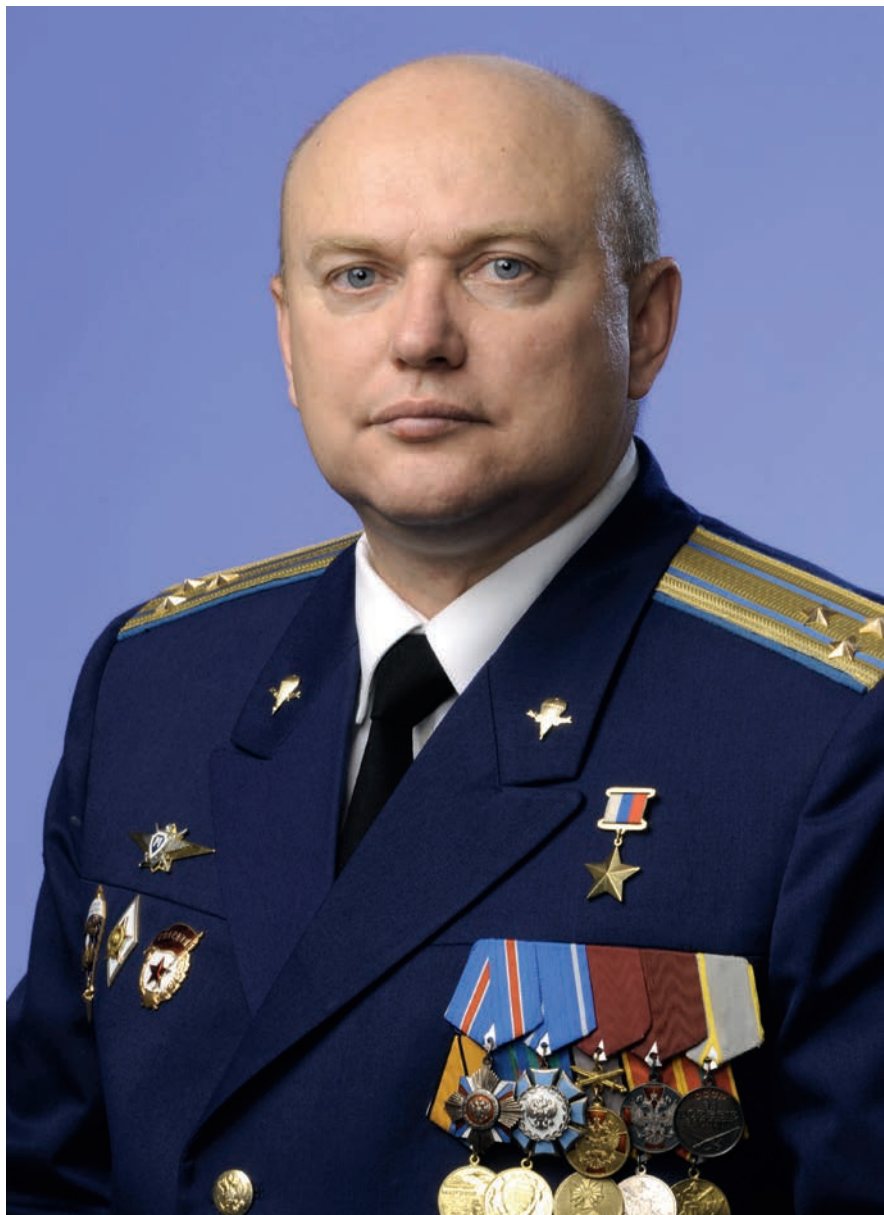
Первый заместитель председателя Комитета Государственной Думы по обороне Андрей Леонидович Красов