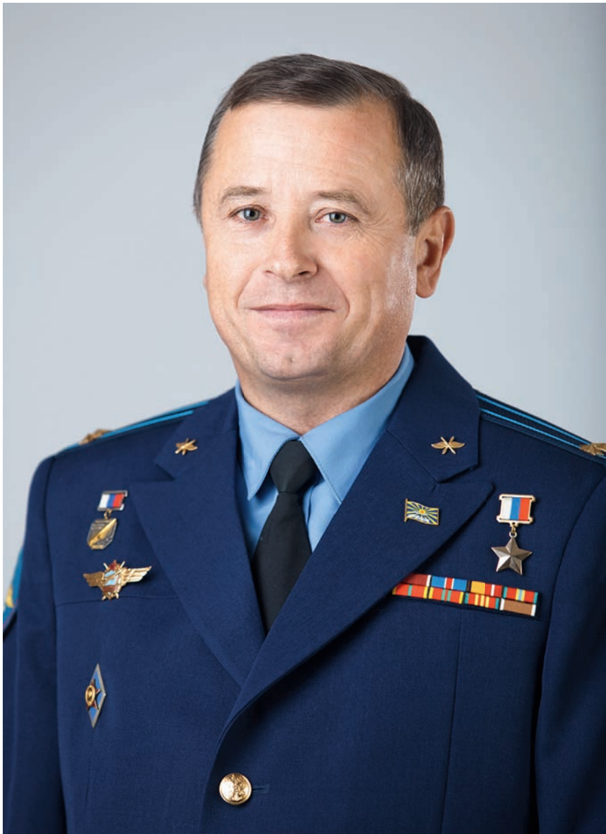
Член Комитета Государственной Думы по обороне Владимир Иванович Богодухов