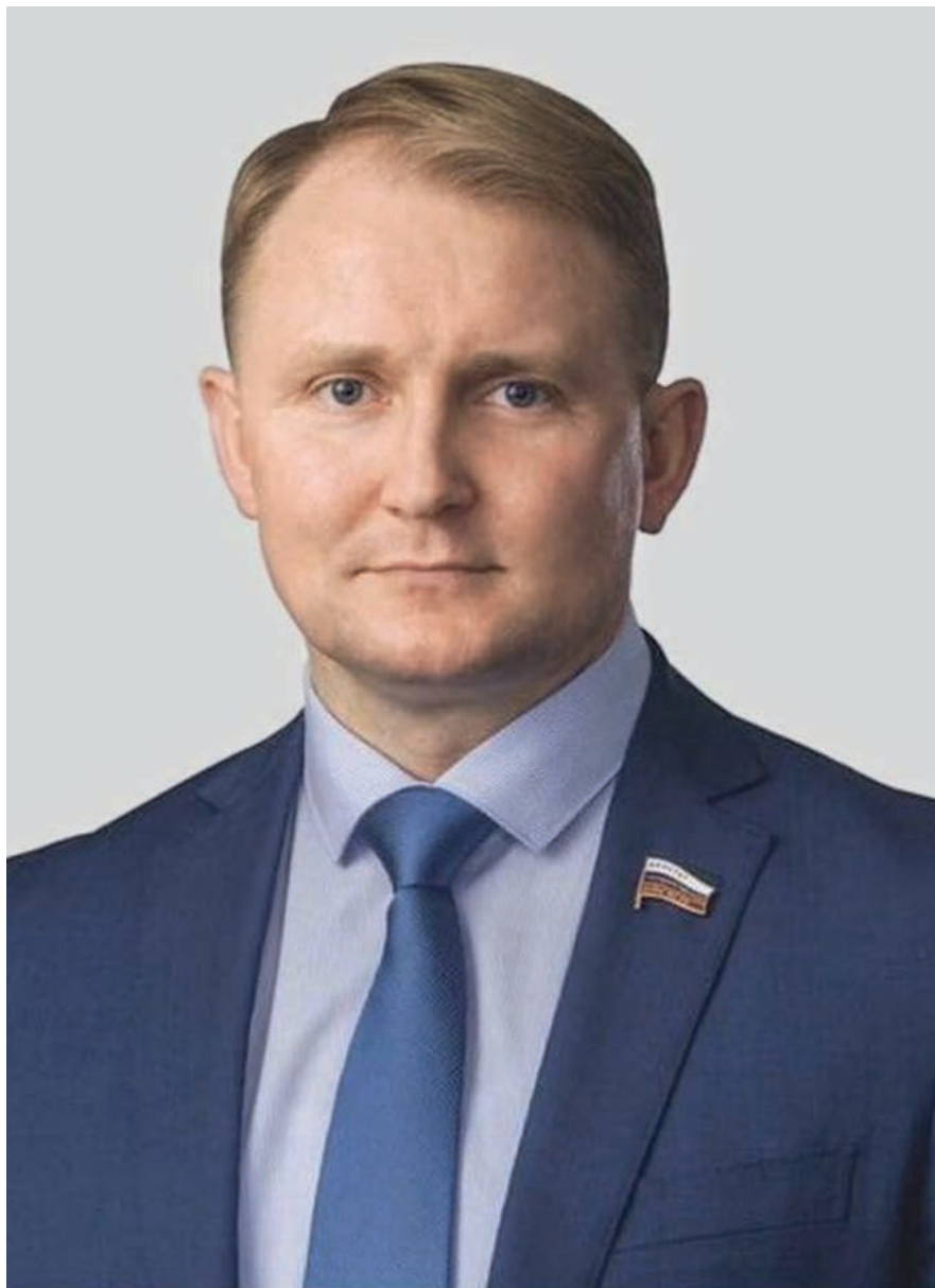
Первый заместитель председателя Комитета Государственной Думы по обороне Александр Николаевич Шерин