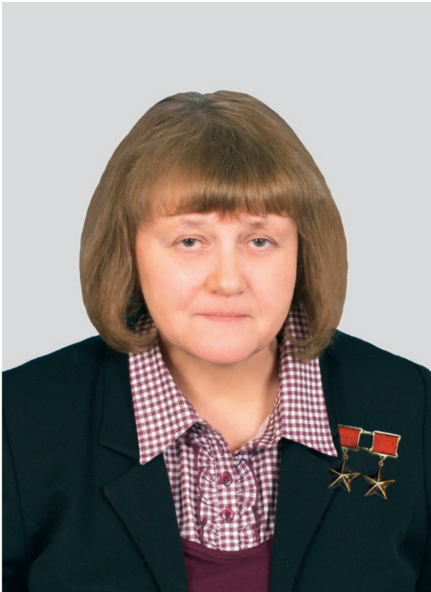
Заместитель председателя Комитета Государственной Думы по обороне Светлана Евгеньевна Савицкая