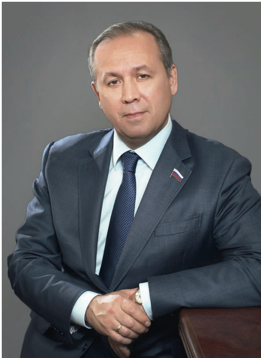
Член Комитета Государственной Думы по обороне Ринат Шамильевич Хайров