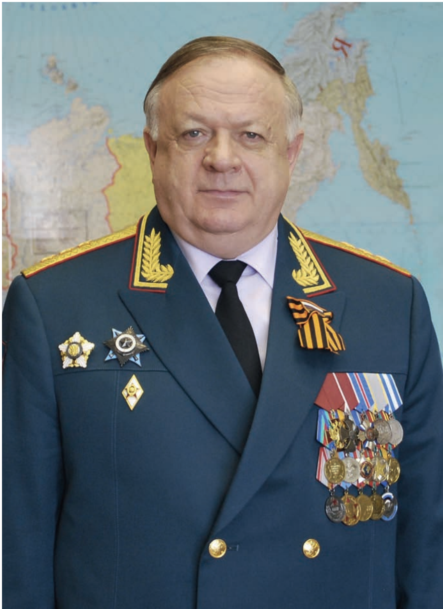
Заместитель председателя Комитета Государственной Думы по обороне Виктор Михайлович Заварзин