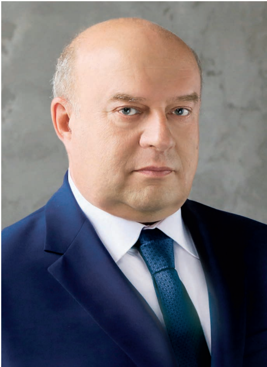
Член Комитета Государственной Думы по обороне Алексей Алексеевич Хохлов