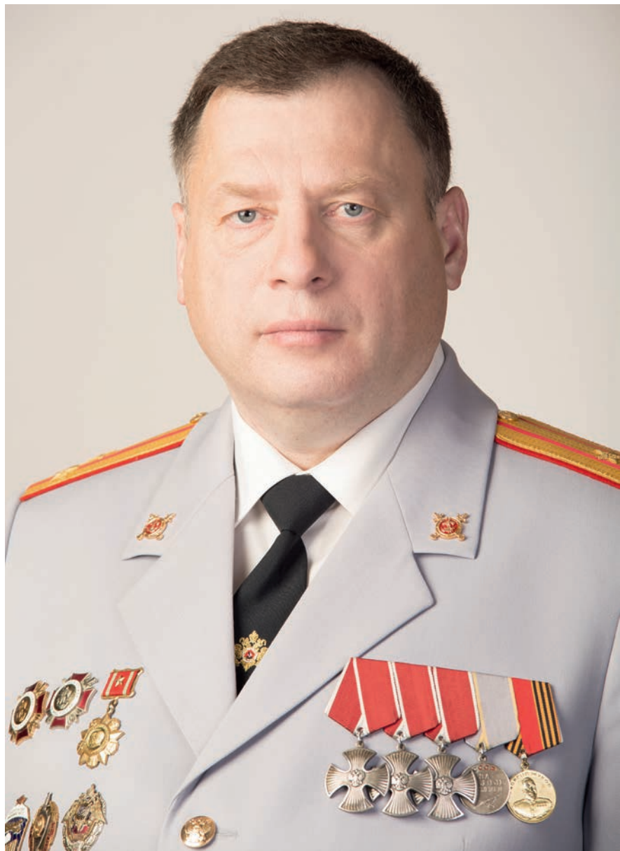
Заместитель председателя Комитета Государственной Думы по обороне Юрий Николаевич Швыткин