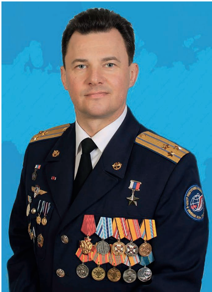
Член Комитета Государственной Думы по обороне Роман Юрьевич Романенко