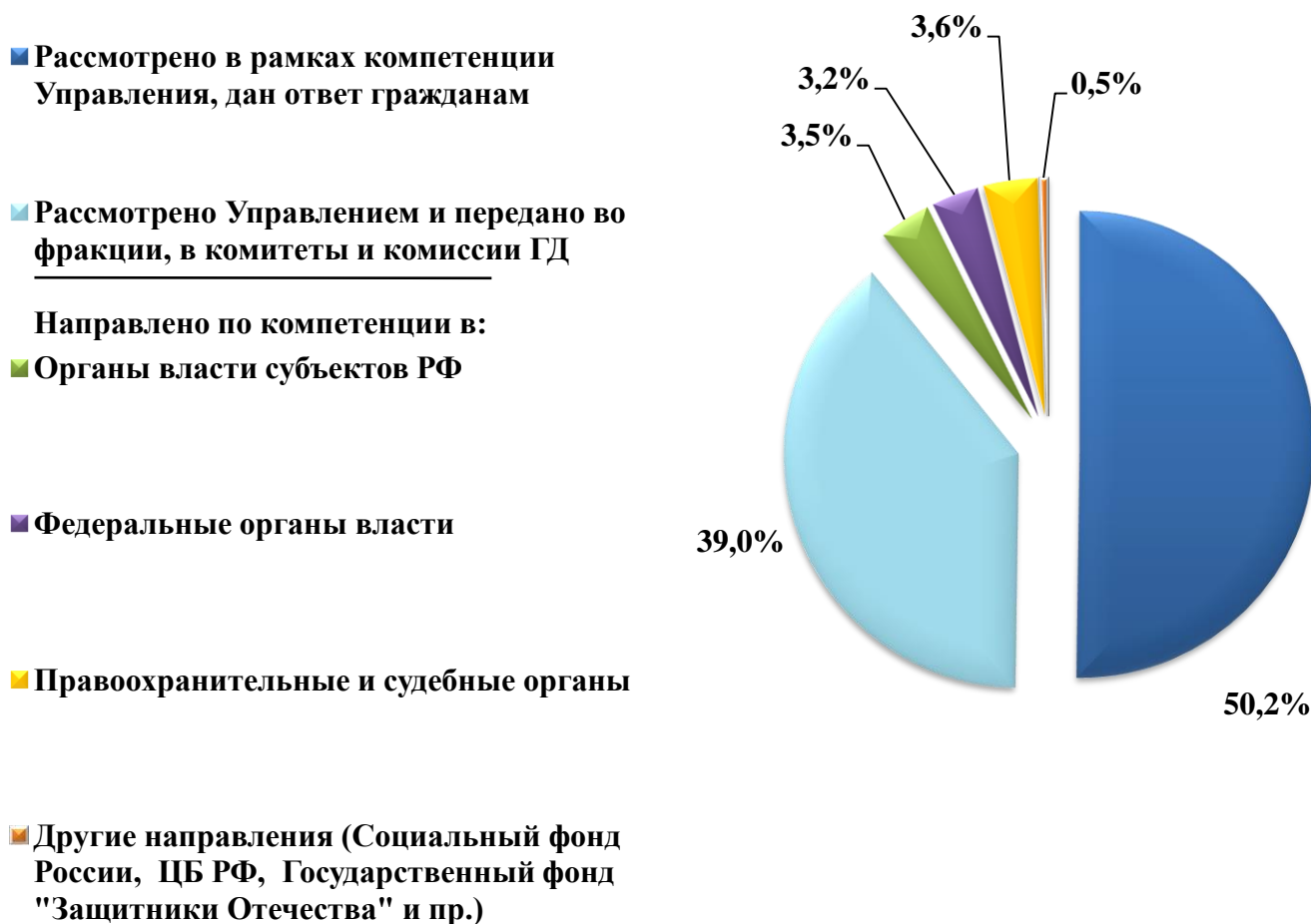
Диаграмма 6. Обращения, рассмотренные Управлением

Государственными гражданскими служащими Управления по работе с обращениями граждан рассмотрено 8 482 обращения, из которых 917 обращений направлено по компетенции.