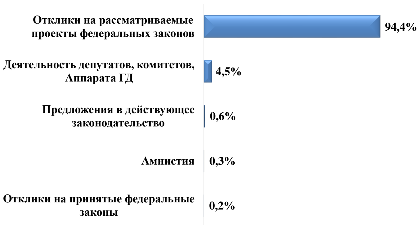
Диаграмма 5. Темы, выбранные гражданами по вопросам ведения ГД

По вопросам ведения Государственной Думы поступило 6 622 обращения.