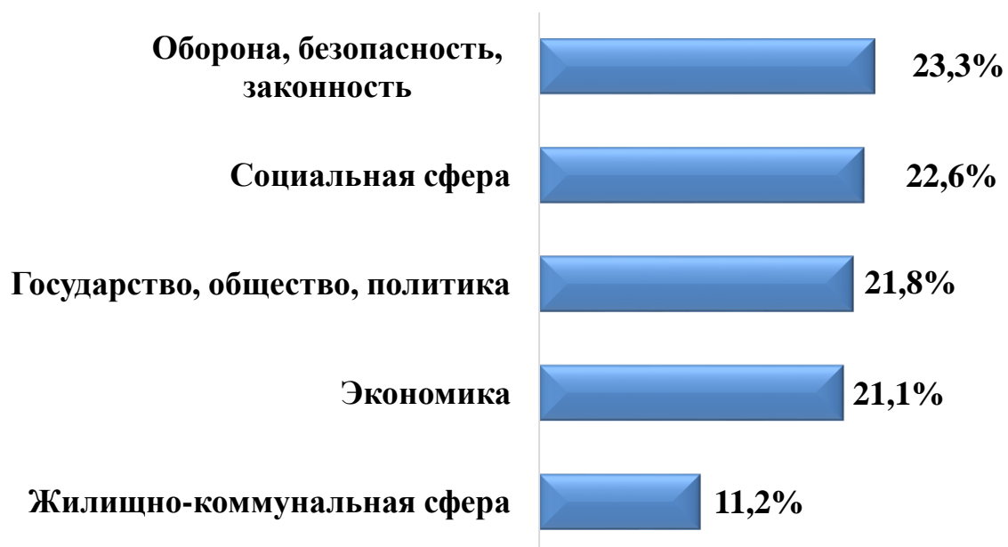
Диаграмма 4. Темы, выбранные гражданами при обращении в ГД

По вопросам ведения Государственной Думы поступило 6 622 обращения.