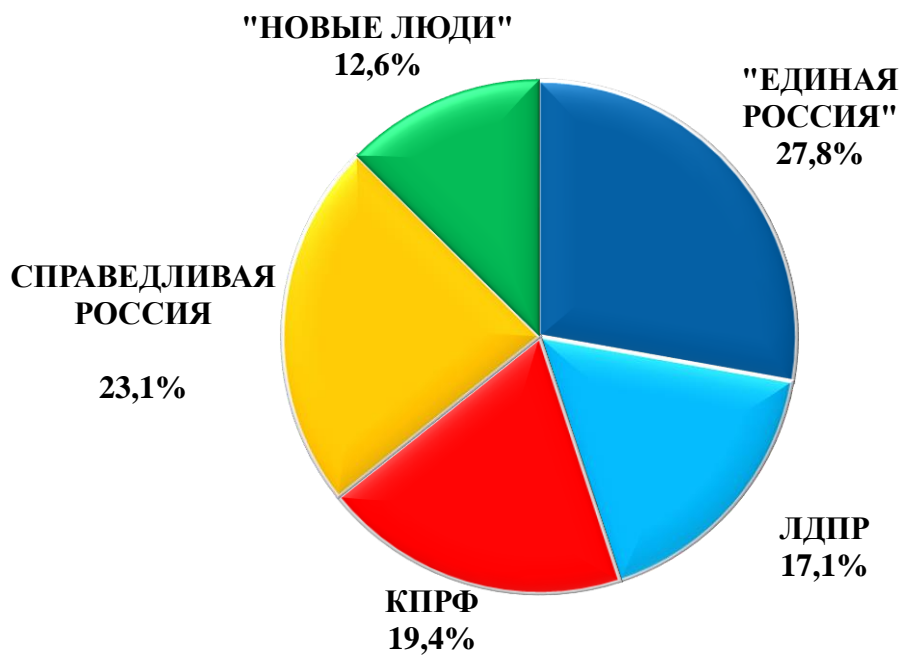
Диаграмма 3. Обращения, поступившие во фракции в ГД

Из них во фракции в ГД поступило 1,7 тыс. обращений