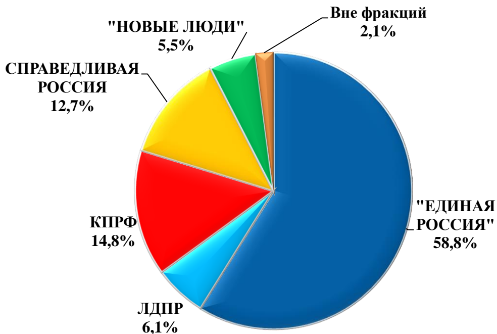
Диаграмма 2. Распределение обращений по фракционной принадлежности

Из них во фракции в ГД поступило 1,7 тыс. обращений